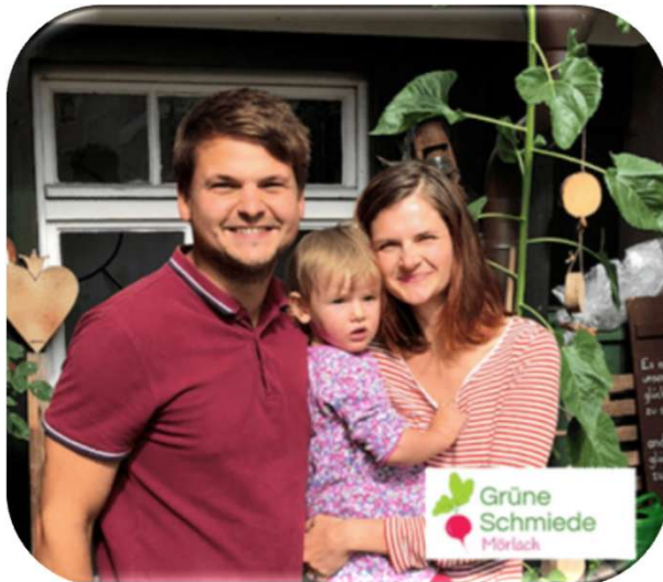
Biodiversitätsprojekt Grüne Schmiede Mörlach

Vorbereitungen von vier neuen Investments bis zur Vertragsunterzeichnung