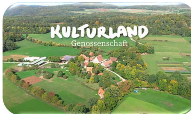
Landkauf Kulturland eG