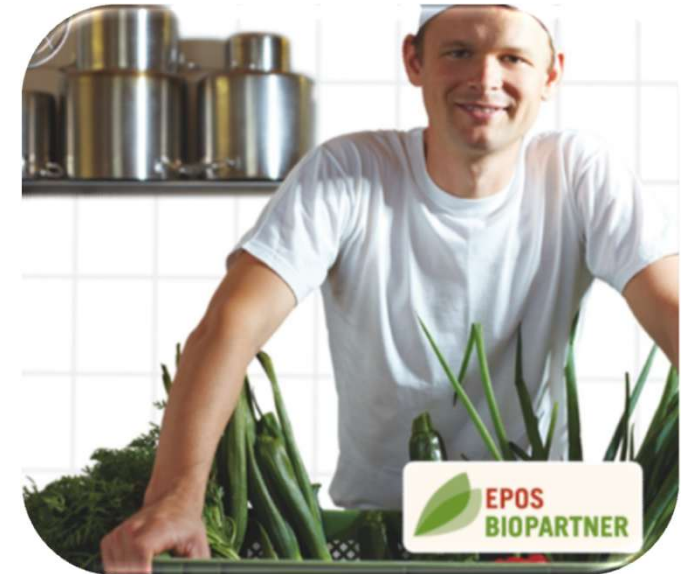
Darlehen EPOS Bio- Partner FRANKEN